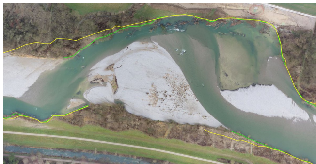
Orthophoto 2015 mit Abrisskanten von 2015 und 2017