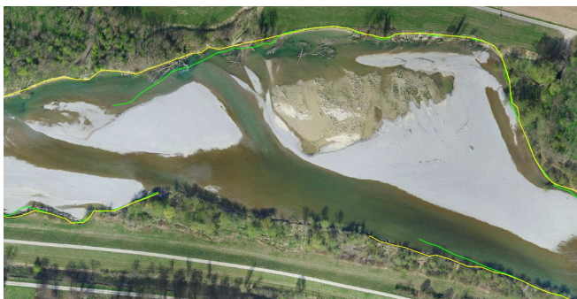
Orthophoto 2017 mit Abrisskanten von 2015 und 2017