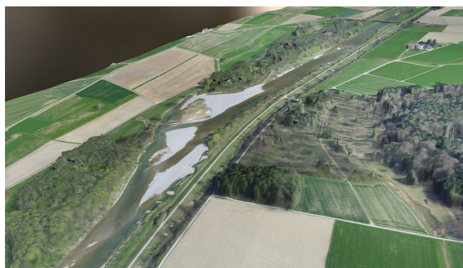
3D-Modell Schöffäuli 2017