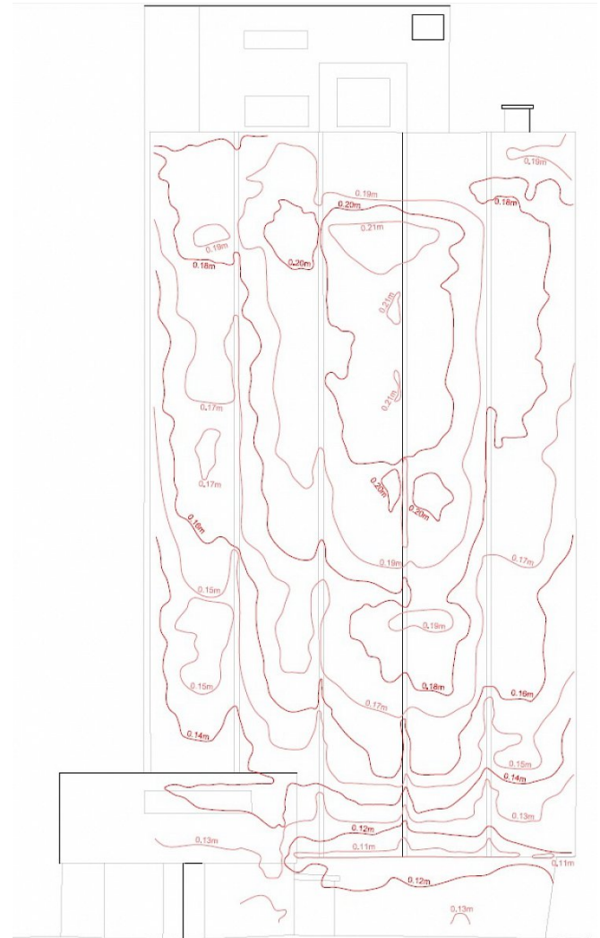
Ostfassade mit ausgewerteten Isolinen