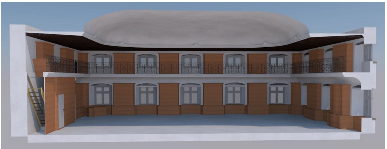
Schnitt durch das 3D-Modell