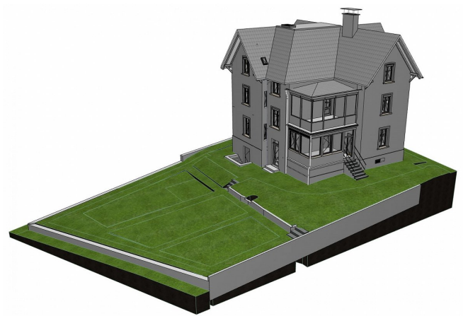
Gebäude- und Geländemodell