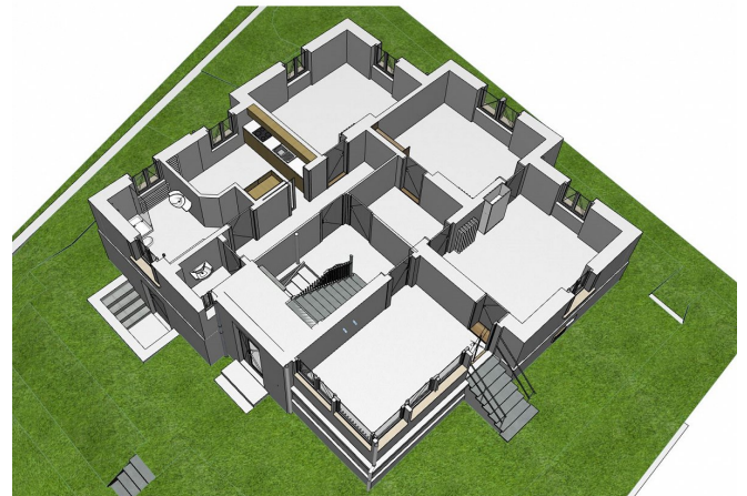
Einblick in das Erdgeschoss des 3D-Modelles