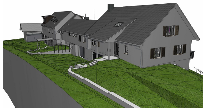
3D-Modell - Sicht von der Strasse