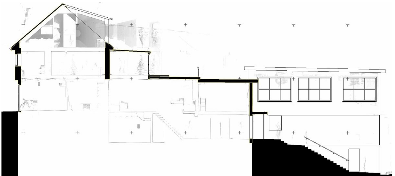
Schnittplan Aussenhülle und Orthobild des Innenraumes